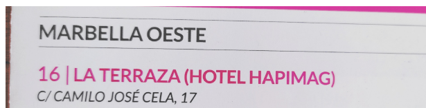
aktuelle Hapimag-Werbung als Hotel

buchung zu den Kosten der Aktionäre Ferienwohnraum nutzen können, ist dies in unseren Augen eine Subvention. Diese offene oder jede versteckte Subvention lehnen wir mit allem Nachdruck ab.